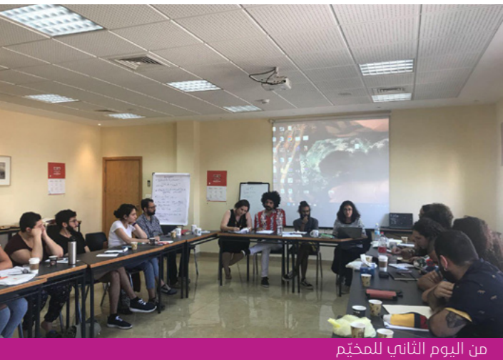
من اليوم الثاني للمخيّم

وقدّم المداخلات مجموعة من الباحثين والأكاديميين من جامعات مختلفة في فلسطين وخارجها، إضافة إلى نشطاء في حركات ومجموعات متنوّعة حول فلسطين؛ مثل جامعة بيرزيت وجامعة حيفا، إضافة إلى مداخلات من نشطاء القوس أنفسهم.