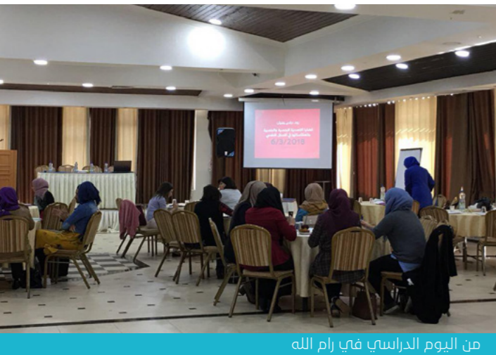
من اليوم الدراسي في رام الله

التي تصقل تجارب أفراد يعيشون توجهات جنسية وجندرية مختلفة، وبالأخص المثليين/ات والمتحولين/ات، وانعكاساتها في سيرورة التدخل النفسي.