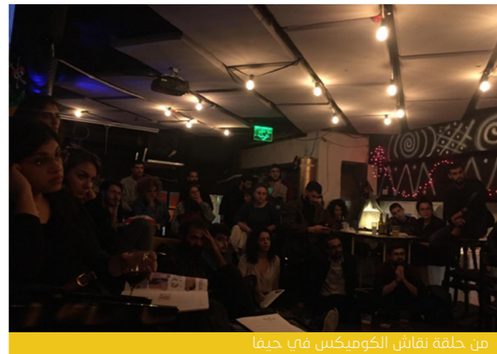
من حلقة نقاش الكوميكس في حيفا

لم يتوقّف العمل بعد أيام المخيّم الثالث، بل نستكمل العمل حالياً مع بعض المشاركين على تطوير مقالات تتعلّق بموضوع المخيّم، على أن يتم نشرها في العام القادم بالتعاون مع منصة نشر عربيّة أو فلسطينيّة.