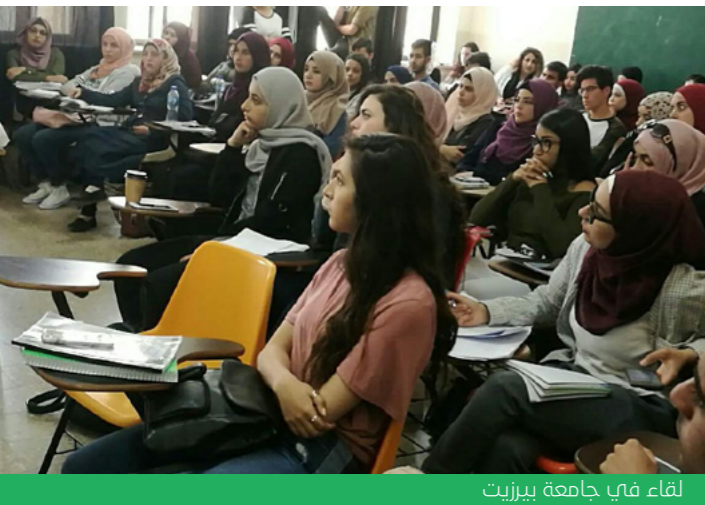
لقاء في جامعة بيرزيت

التجارب الشخصية وموضعها في سياقها الأوسع. كان لنا هذا العام تدريبين في منطقة القدس، واثنين آخرين في حيفا ، إضافة إلى كل من الناصرة وجامعة بيرزيت.